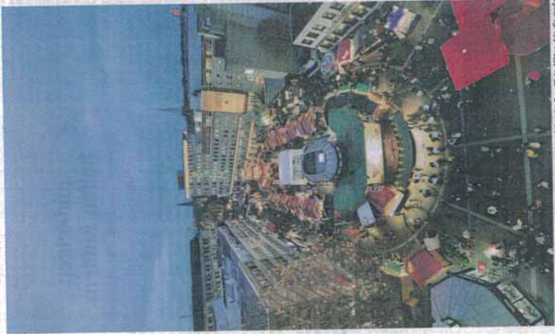
Blick vom Dach der Sparbasse auf den Weihnachtsmarkt auf dem Dr.-Suer-Platz. Mitten öfen die große Bühne, auf der an jedem Tag Unterhaltung und Musik präsentiert werden.