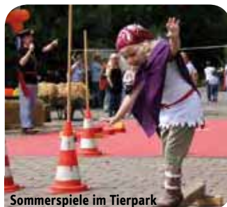
Sommerspiele im Tierpark

Kinder können bei Kostümwettbewerben teilnehmen, bei Tierparkrallyes tolle Preise gewinnen oder bei der Fütterung der Haie, Schlangen und anderer Tiere zuschauen. So manche der Tierkinder sind noch ohne Namen,